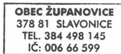
Luboš Bureš Starosta obce

Dle ust. § 97 stavebního zákona do 15 dnů ode dne veřejného projednání, tj. do 15.3.2025 včetně , může každý uplatnit písemně své připomínky k návrhu územně plánovací dokumentace a vyhodnocení vlivů. K připomínkám uplatněným po stanovené lhůtě nebo uplatněným ve věcech, o kterých bylo rozhodnuto v nadřazené územně plánovací dokumentaci, se nepřihlíží.